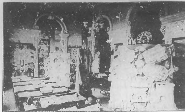
EN LA ESCUELA 16 —Preciosas labores confeccionadas por las alumnas de la Escuela Núm. 16 y de las que hicieron recientemente una exposición, que resultó muy lucida y fué unánimemente elogiada.

El Asilo Rafael de Cárdenas se alzaría, con capacidad para 1,500 educandos, en Jacomino. El terreno de ese cristiano instituto mide cuarenta y seis metros de ancho por cuarenta y tres de fondo. Los niños—es decir, las niñas—recibirán en sus aulas la instrucción que deseen. Las clases oficiales son éstas: kindergarten, para los dos sexos, hasta los seis años de edad; curso escolar de primera enseñanza; departamento de costura; lavandería