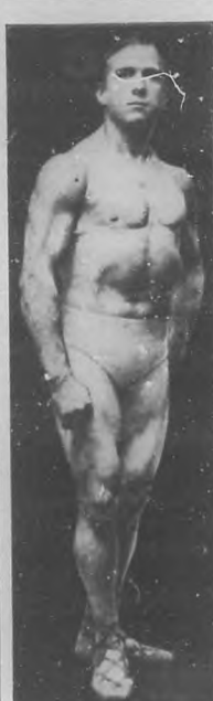
STRONGFORT El Hombre Perfecto.