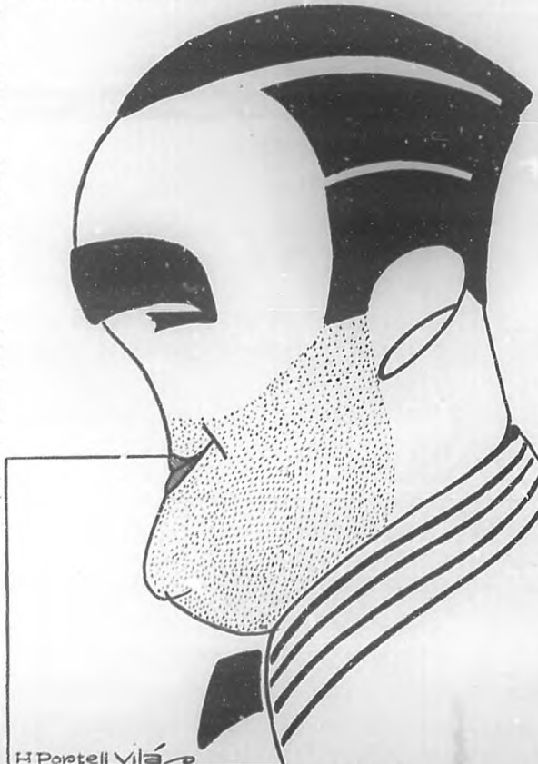
CONRADO W. MASSAGUER (Caricatura por Portell Vilá.)