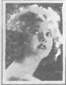
BETTY COMPSON Famosa Actriz del Cine.

Si quieres tener hermosos y saludables cabellos, tenlos cuidados con el uso de jabones. La mayoría de los jabones y champús preparados contienen un exceso de álcali. Esto deseca el cuero cabelludo, haciendo el cabello frágil y quebradizo.