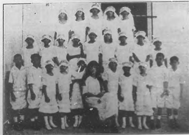
LA INSTITUCION BENEFICA "RAFAEL DE CARDENAS".—Grupo de niños perteneciente a esta altruista asociación, que hicieron la primera comunión el pasado mes en la iglesia de Jesús del Monte.

Este notable escritor, que desde hace ocho