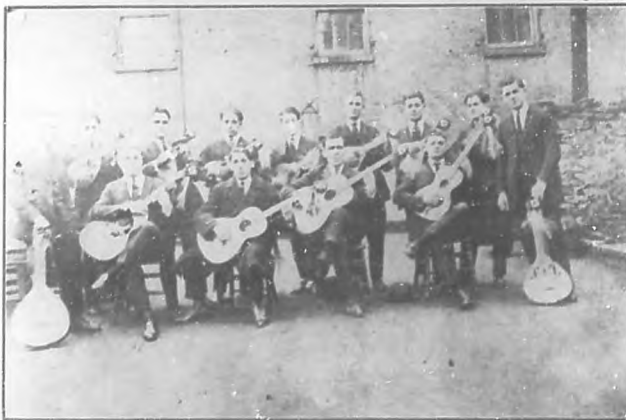
HOMENAJE A UNA INSTITUCION MUSICAL —La famosa rondalla del Club Coruña neoyorkino, en cuyo honor se celebró recientemente un banquete al cual fué invitado el corresponsal de BOHEMIA en aquella ciudad. Fué un vibrante homenaje de simpatía a la Sección de Filarmonía de dicho Club, cuyos éxitos adquieren más relieve cada día.

manos tan finas como piadosas se han apresurado a remediar los daños de la incultura y de la irregularidad que amenazaban convertir los barrios de Jacomino y Rocafort en un abrupto rincón del África. Estos dos extensos contornos se asoman, desde el altonaz, a un panorama de maravillas. La atalaya descubre un pequeño bosque que al través de cuyos árboles se encuadra la visión luminosa de la ciudad, con sus casas radiantemente blancas, y el azul y el oro de la bahía; azul en las aguas; oro en el paisaje, bañado por el sol.